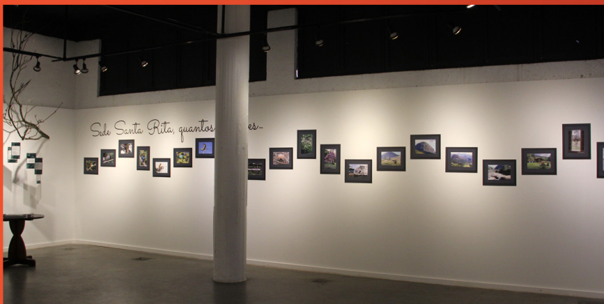
Exposição, que ocorreu em 2019, do livro Parque Municipal Natural Montanhas de Teresópolis, publicado pela Editora Unifeso.

Em 2021, a Galeria de Artes do Centro Cultural Feso Pro Arte abre espaço para exposições ambiciosas, incentivando a produção de conhecimento no intuito de aproximar o público com os artistas através de oficinas e workshops gratuitos.