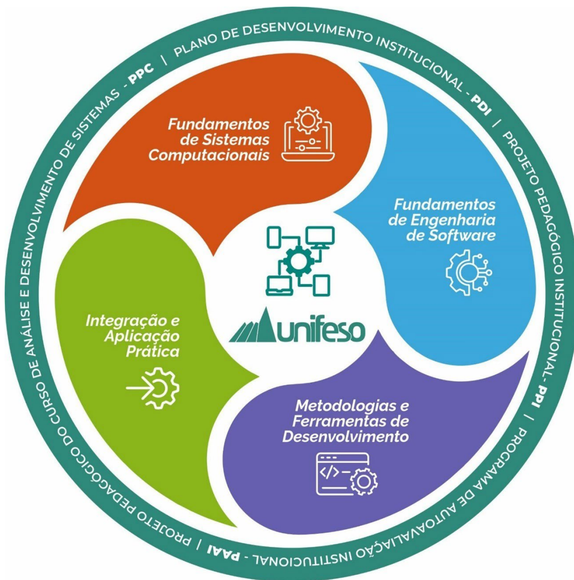
Figura 2 – Representação Gráfica dos Eixos Curriculares.